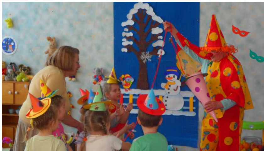
II. jaunākā/vidējā mazākumtautību grupa – aplicēšana „Cepuru balle”

Pēc rotaļnodarbībām, katras grupas skolotāja prezentēja paveiktā darba rezultātus, īsumā pastāstot par izpildes tehniku un atbildēja uz interesējošiem jautājumiem. Pēc pārrunām skolotājiem bija iespēja aplūkot tematisko izstādi ar dažādiem tēlotājdarbības tehnikas veidiem. Kā arī pēc skolotāju iniciatīvas tika organizēta ekskursija pa grupām, kuras laikā notika pārrunas par redzēto.