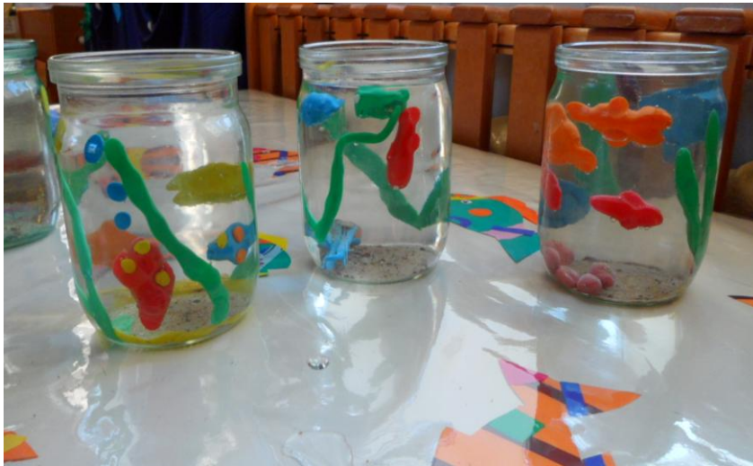
Vecākā mazākumtautību grupa – darbs ar plastilīnu „Jūras piedzīvojumi”